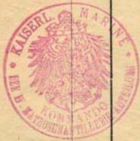
Figure 11 : militärpass d'un artilleur de la marine qui a effectué une manœuvre juste avant le début de la guerre.