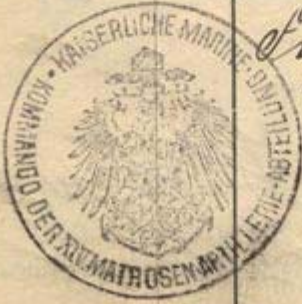
Figure 12 : le même matelot a été mobilisé le 4 août 1914 au sein de la 8 e compagnie du II e Matrosen Artillerie Abteilung (inscription sur les 2 premières lignes : "infolge Mobilmachung von k 8 II A A). Le 1 er septembre 1916, il passe à la 4 e compagnie du XIV e Matrosen Artillerie Abteilung. Ce feuillet est daté du 30 novembre 1916, la veille de sa mutation à la 1 ère compagnie du VI e Matrosen Artillerie Abteilung.