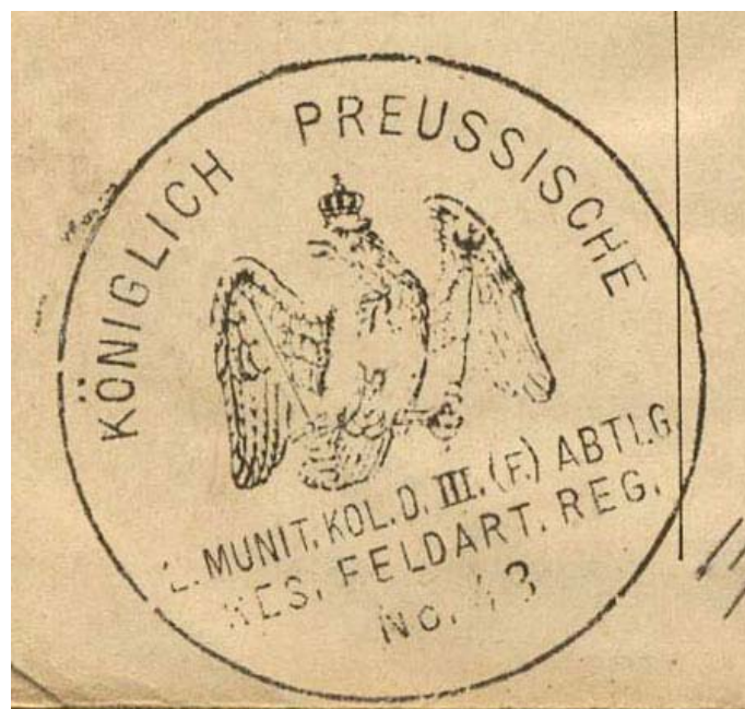
Figure 5 : tampon de la Leichte Munition Kolonne du Reserve Feld-Artillerie Regiment 48.